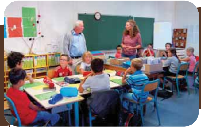
Ecole Lucie Aubrac