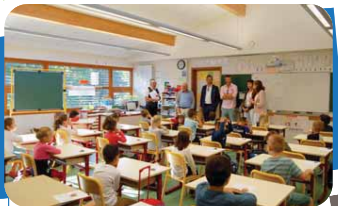
Ecole Albert Jacquard