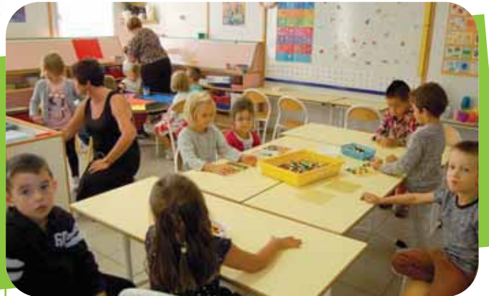
Ecole Notre Dame du Château