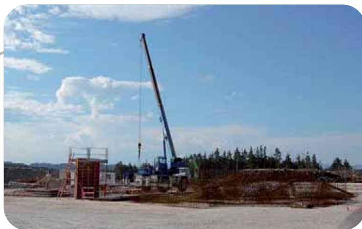
La construction du futur bâtiment de stockage des plaquettes de bois est en cours.

Actuellement, l'unité "Energie Bois" de Monistrol dessère 12 chaudières, en Haute-Loire, dans la Loire et dans plusieurs autres départements de Rhône-Alpes.