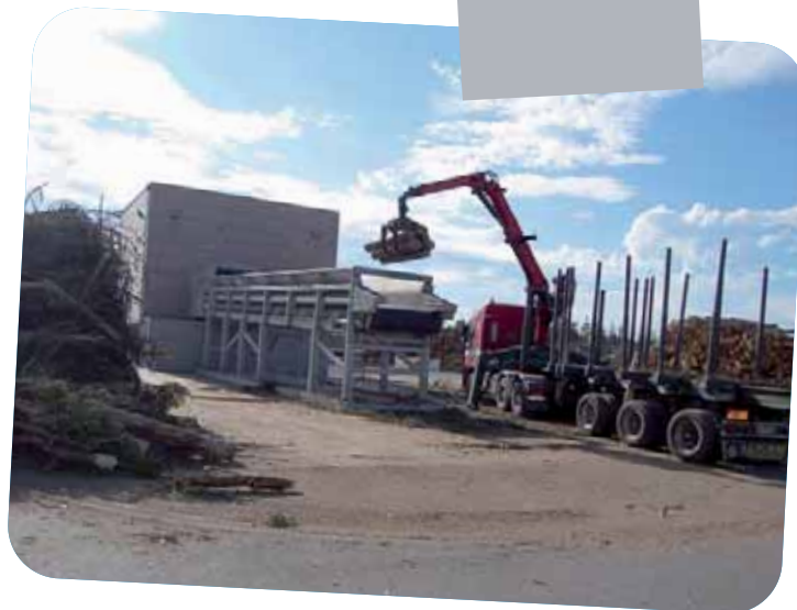
Un grumier alimente le tapis roulant du broyeur à bois dont le niveau sonore est faible.

La création de ce combustible permet en outre de nettoyer les forêts et de réduire la quantité de déchets verts enfouie au CET.