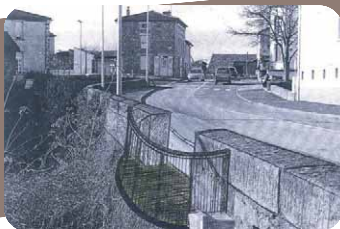
A gauche, le pont Martouret aujourd'hui ; à droite, une projection du futur balcon.